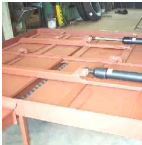
Flissilobotn med skrap sylindere