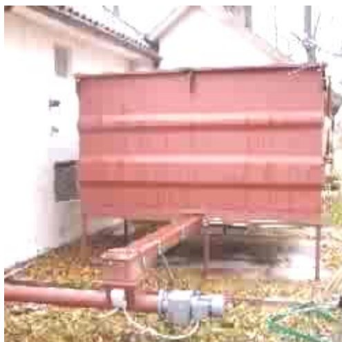
Eksempel på utmatingsløsning

Selve vannkjelen kommer også i tillegg. Se separat brosjyre.