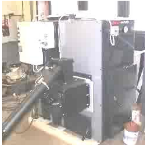
Flisbrenner med skrue og kjele