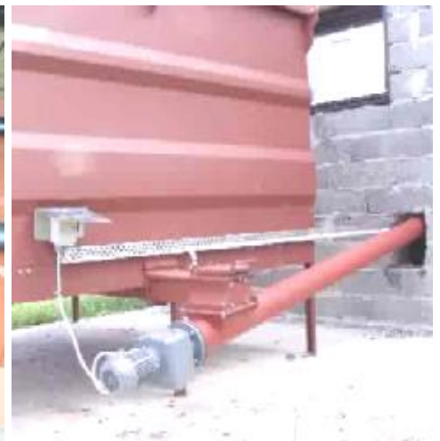
Eksempel på utmatingsløsning