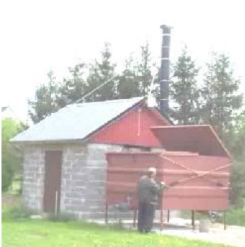
Flissilo kan plasseres utendørs