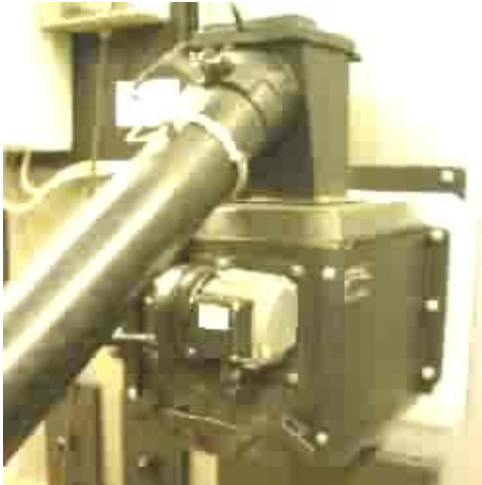
Flisbrenner med skrue