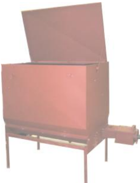
Flissilo på 1600 liter