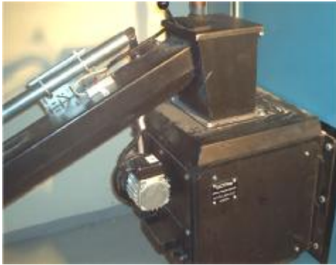
Flisbrenner med skrue