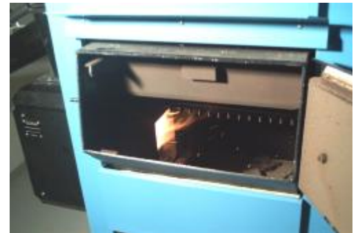
Kjele med åpen dør og flamme