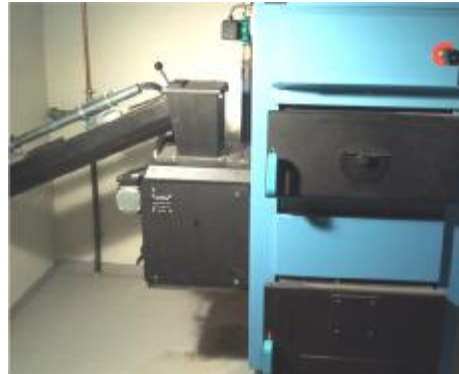
Flisbrenner med skrue og kjele